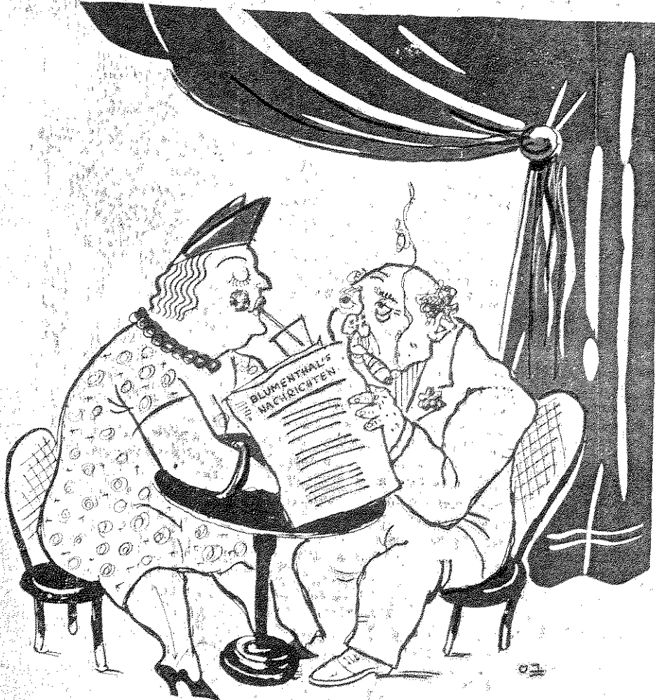
כספון - בשוויץ, הוילה שלנו - בקפריסין, ילדינו לומדים - בלונדון אבל לבנו, כנראה, כבר ישאר בארץ